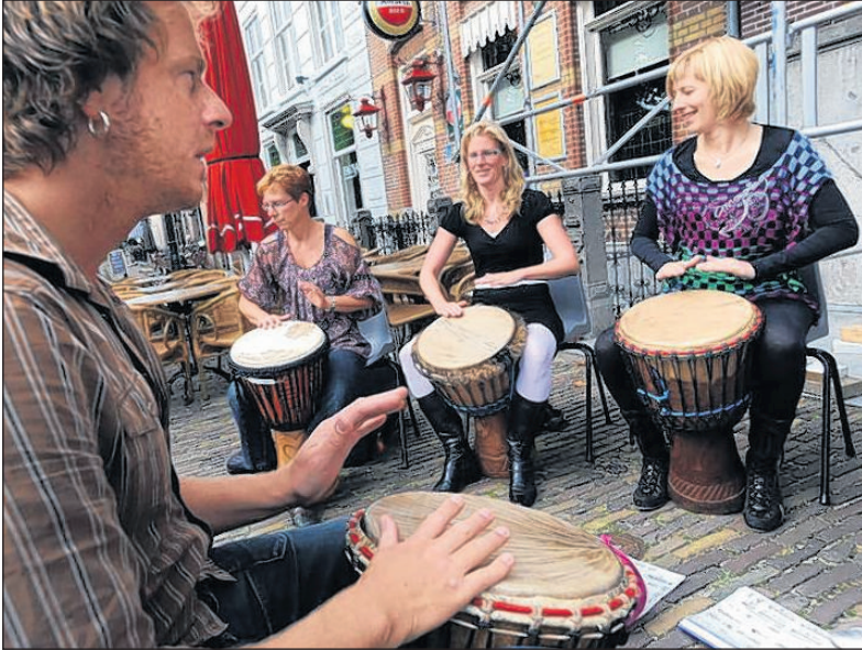
De bezoekers aan de Doedag van Amadeus konden zelf een instrument bespelen, zoals de djembé.

In de rubriek Terugkijken blikken we op dinsdag nog even terug op een evenement uit het afgelopen weekend. Dit keer doen we dat met Hugo Verweij, hoofd van de afdeling muziek van Centrum voor de Kunsten (CvK) Amadeus in Geertruidenberg. Zaterdagmiddag hield de vereniging de jaarlijkse Amadeus Doedag in en rond de Schattelij. Jong en oud kon deze dag kennismaken met podiumkunst en hun talenten botvieren op muziek en dans.